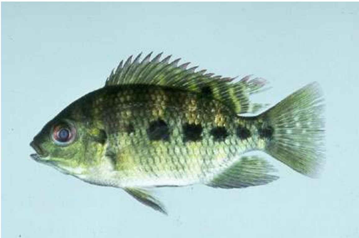
Figura 3. Fotografía de tilapia.

Este sector constituye el principal motor de la economía tabasqueña; aportando un total de 53.2 mil mdp o el 68.64% del PIB estatal. Las principales actividades están comprendidas en las ramas de servicios personales, bancarios y financieros, comunicaciones y transporte y comercio.